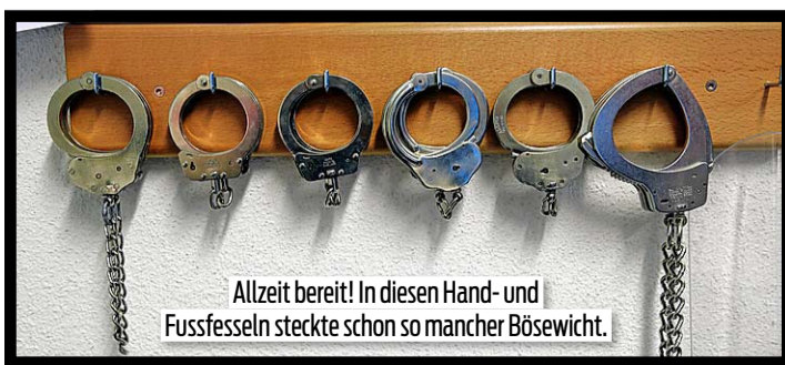
Allzeit bereit! In diesen Hand- und Fussfesseln steckte schon so mancher Bösewicht.

«Die Alpakas machen einfach Freude. Da kann man richtig abschalten.»